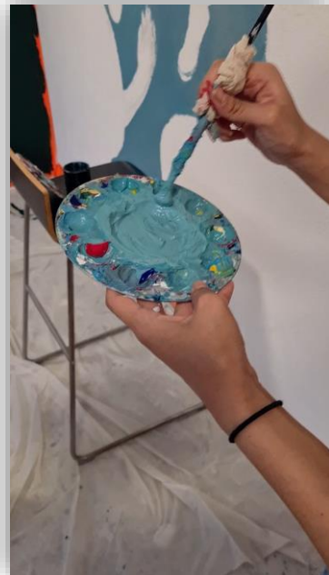
Vidéo réalisée par l'étudiante Andréa Girr