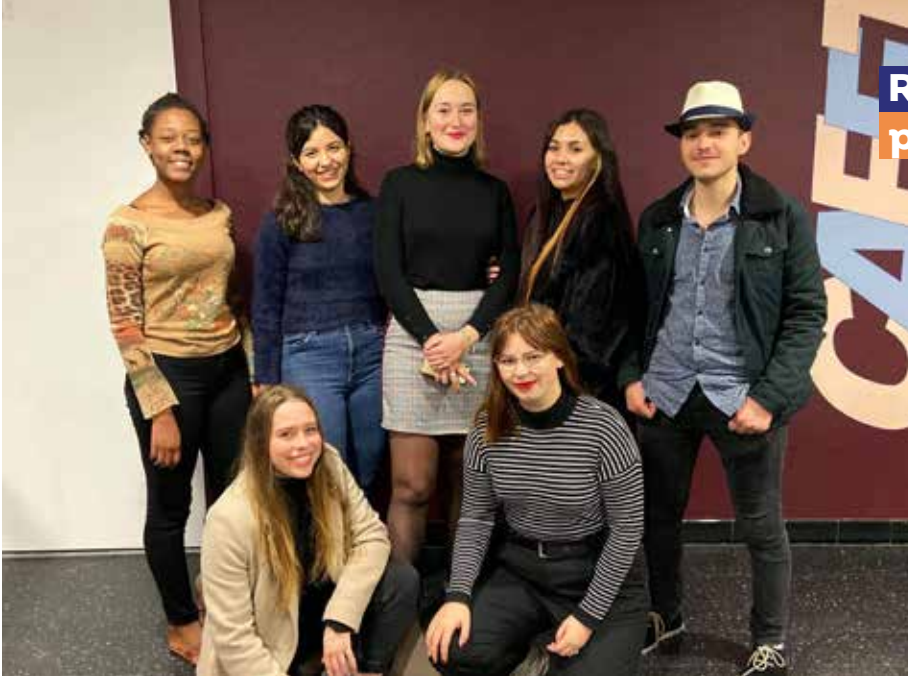
Tonique. L'équipe du conseil de résidence de la cité de la Robertsau