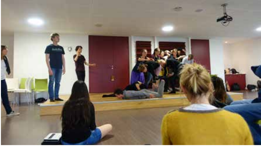
Ateliers franco-allemands - 2019