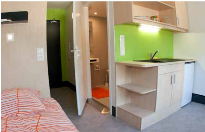
Une chambre en court séjour à la résidence des Alternants

Une semaine, un mois, trois mois... Toutes les formules sont possibles avec l'offre courts séjours déployée par le Crous de Strasbourg. Les infrastructures sont à la hauteur de ce positionnement.